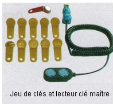
Jeu de clés et lecteur clé maître